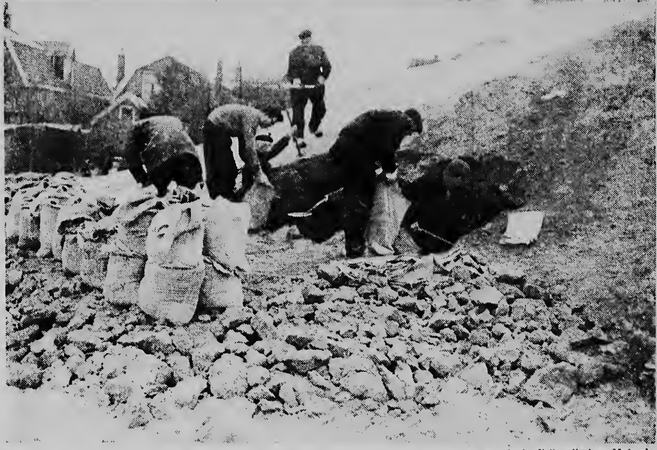
Den e provincia di Overijssel na Holanda nan ta mira dilanti. Pa combati e inundacionnan cu lo bini sigur ora cu cuminsa deshiela for di awor caba nan ta jena sacunan cu sauti pa usa nan ora cu tin mester.